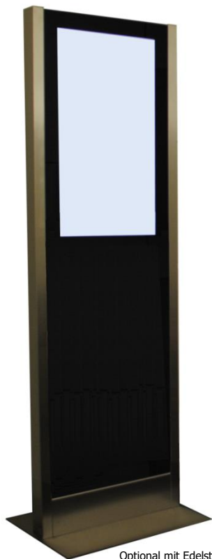
Optional mit Edelstahl Fussplatte

Der H-Type ist ein professionelles Informations- und Anzeigesystem für die verschiedensten Anwendungen.